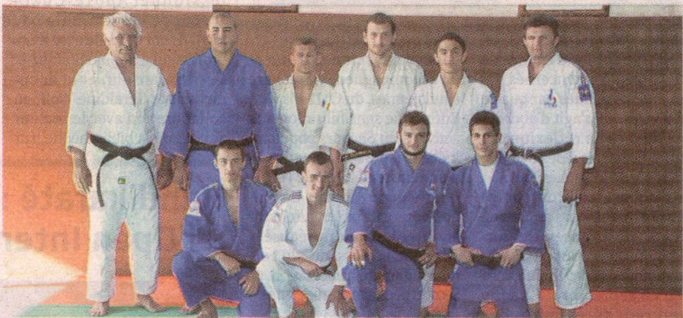
■ Les stagiaires étrangers reçus par le Judo Rhodia Club de Vaise.

« L'esprit ouvert à la compétition et à l'amitié internationale »